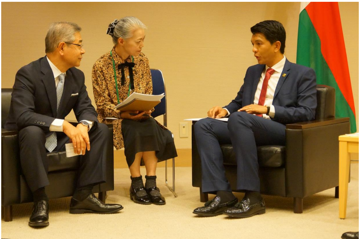
ラジョリナ大統領との会談

当社 里見社長が第 7 回アフリカ開発会議（TICAD7）開催期間中の 8 月 29 日にマダガスカル共和国 アンジ・ニリナ・ラジョリナ大統領と面談、その後インフラ分野における協力 MOU を締結致しました。大統領からは当社に対しマダガスカル共和国のインフラ整備への協力へ期待が寄せられました。又、この MOU の内容は TICAD7 の公式サイドイベントである JETRO 主催「日本・アフリカビジネスフォーラム」の席上でも紹介を受けております。当社は今後もマダガスカル共和国をはじめとするアフリカ諸国でのビジネスを通じてアフリカ地域の発展に貢献して参ります。