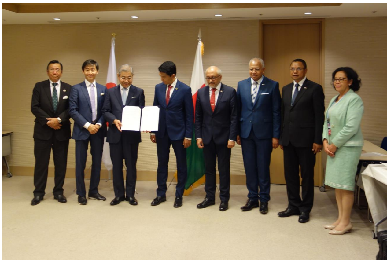
ラジョリナ大統領（左から4人目）とマダガスカル政府高官（大統領右側） 駐マダガスカル小笠原特命全権大使（左から2人目）、里見社長（左から3人目）